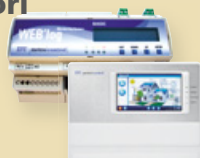
Meteococontrol WEB'log e Meteococontrol WEB'log Comfort Data logger