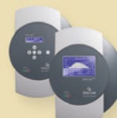
Solar-Log 500/1000™ Data logger